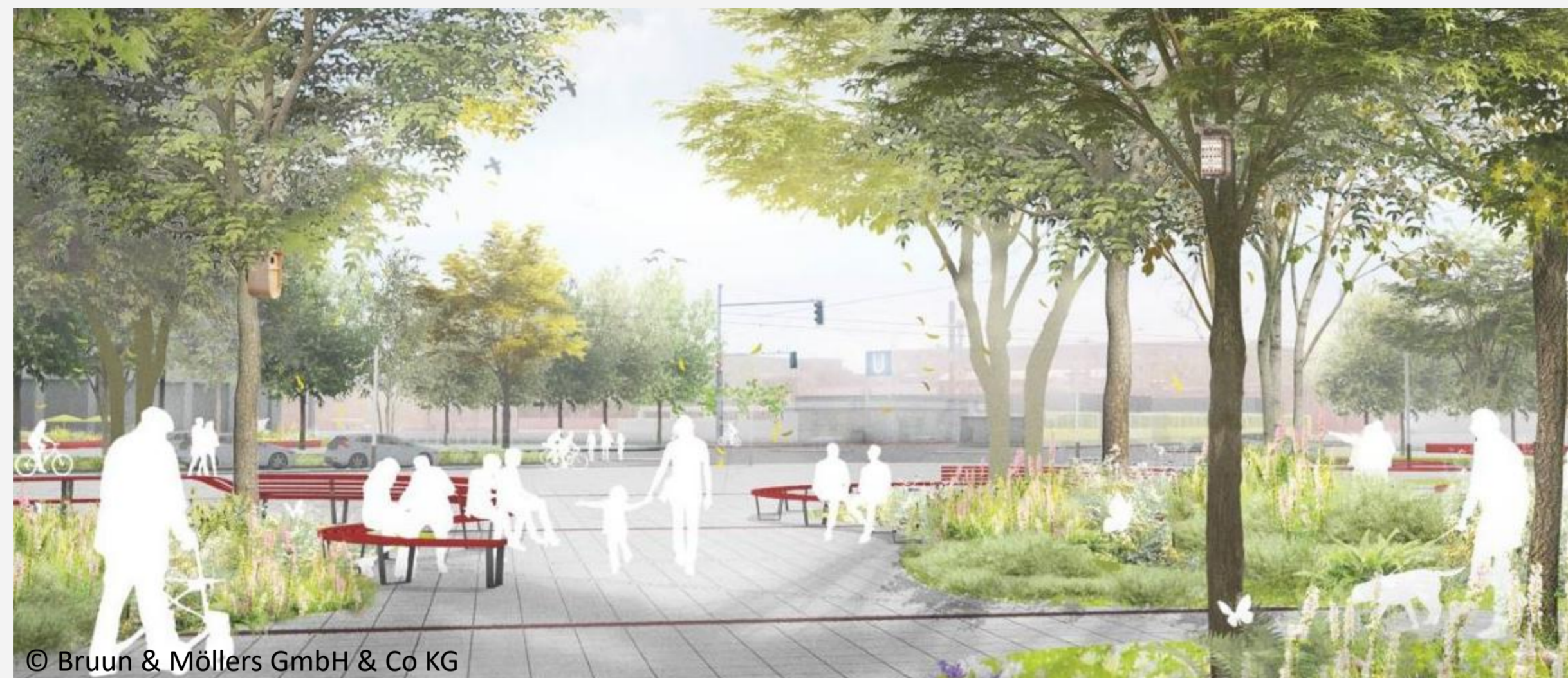
© Bruun & Möllers GmbH & Co KG