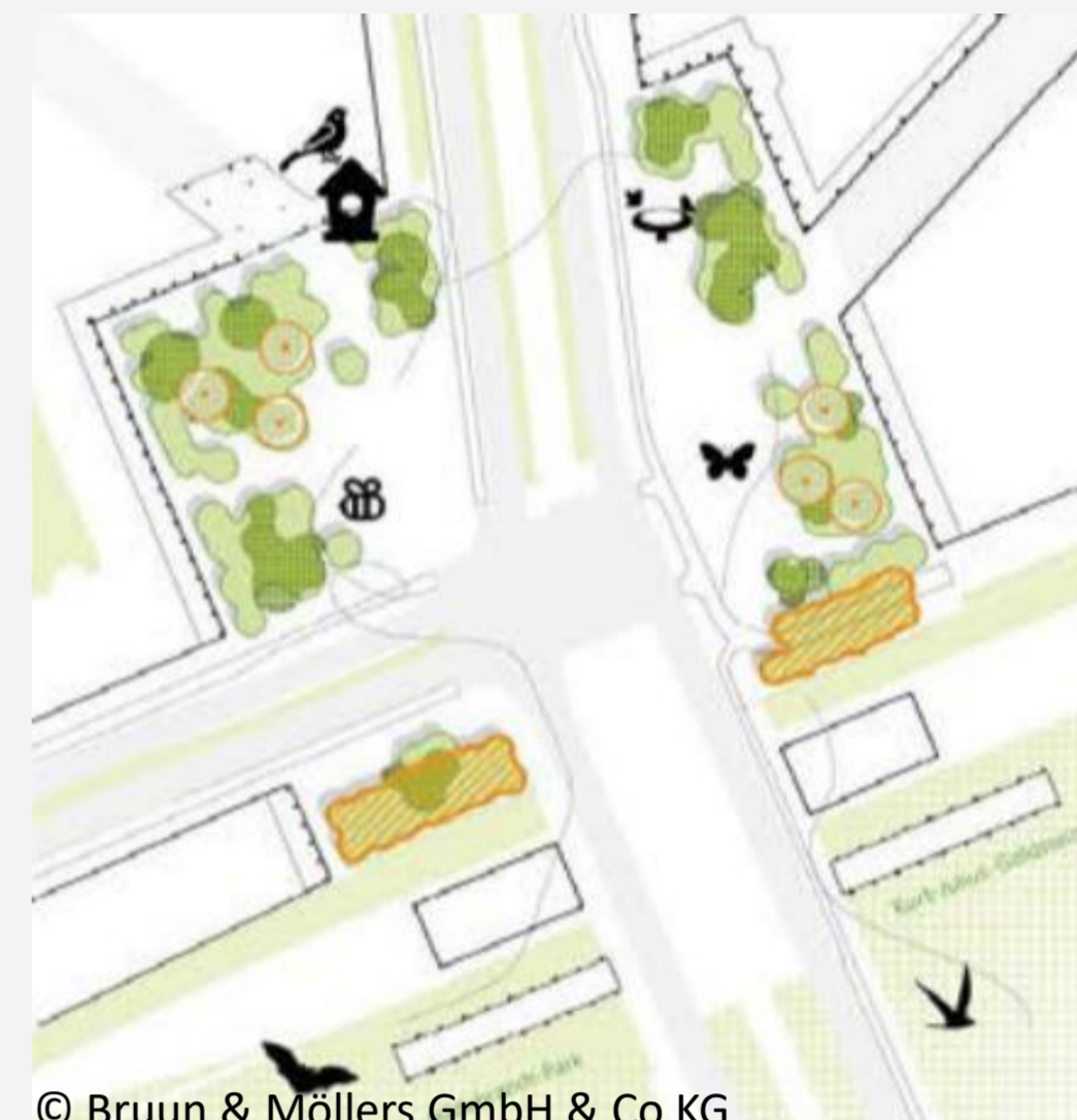
© Bruun & Möllers GmbH & Co KG