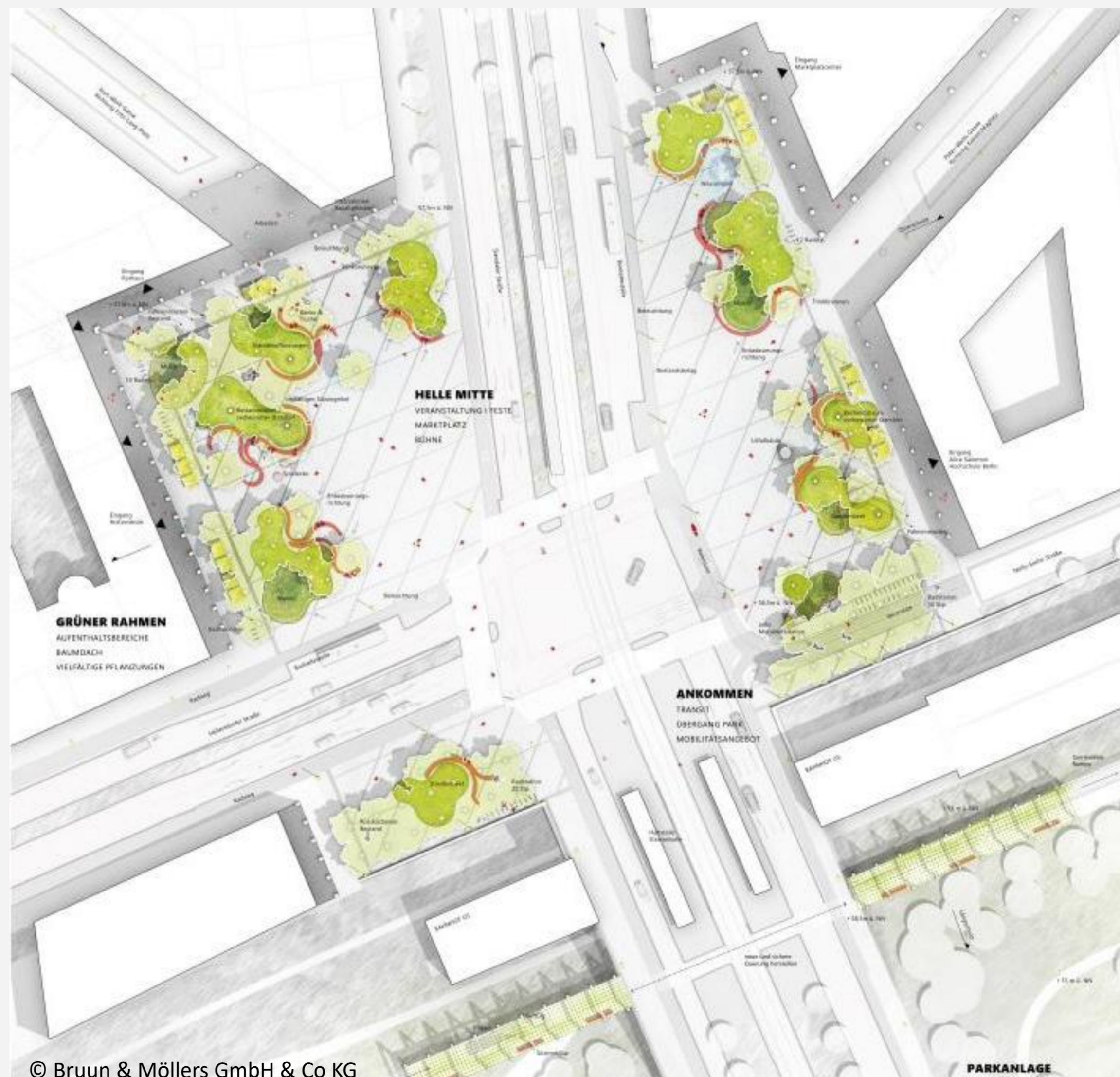
© Bruun & Möllers GmbH & Co KG